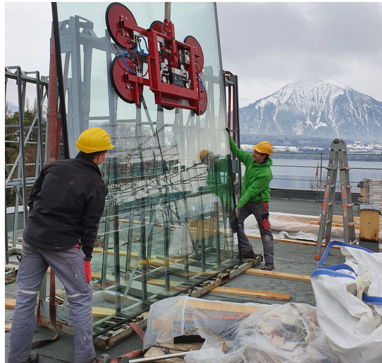
Fenstermontage im Neubauteil.