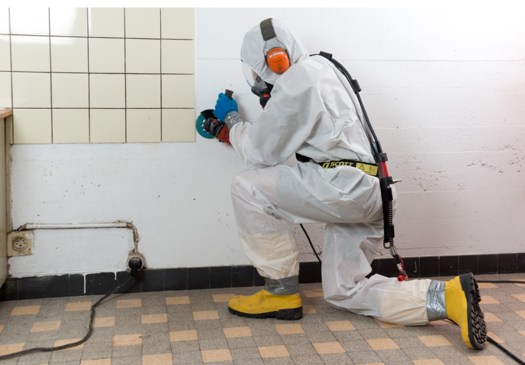
Schadstoffsanierung asbesthaltiger Plattenkleber.

Schadstoffsanierungen AG ■ Beratung ■ Diagnose ■ Sanierung