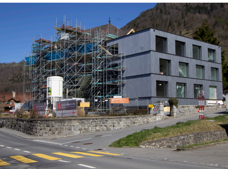
Aussenansicht Pflegeheim «Des Alpes» in Merligen mit Neubauteil.